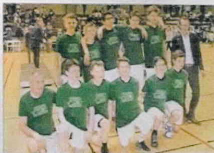
Les vainqueurs de la Chorale de Roanne.