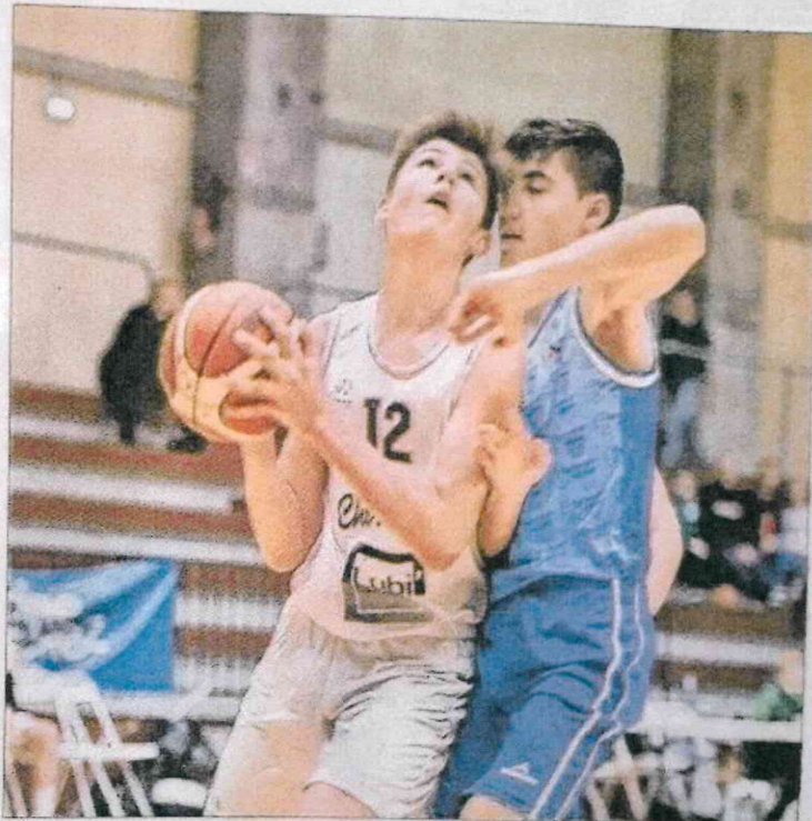
Les Choraliens, en blanc, ont écarté les Espagnols de Cornella en demi-finale.

Le nombreux public s'est vu offrir en match de clôture un remake de l'édition 2018. Une belle affiche et une revanche à la clef. Et elle a eu lieu. La Chorale de Roanne a survolé les débats face à des Villemomblois émoussés. Une domination athlétique, un effectif plus complet et une richesse de jeu intéressante, c'est donc en toute logique que les Ligériens s'imposent avec, comme fer de lance, Vergiat, élu meilleur joueur du tournoi, et Lambert, entre autres. Villemomble a eu