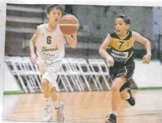
La Chorale de Roanne en blanc, contre Veauche en noir.