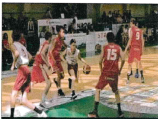
INSTITUTION. Dédié aux benjamins (U13), le tournoi international de Pâques a réuni six équipes étrangères et huit formations ligériennes pour le tournoi Loire Forez.

Pour cette 49 e édition qui s'est déroulée du vendredi 19 au dimanche 21 avril, les compétitions ont été réparties entre la salle Cherblanc, le gymnase Dubruc et la salle Soleillant pour les douze équipes benjamins (U13) présentes, dont six venues