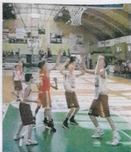
Une finale disputée.

MONTBRISON Basket - 49 e Tournoi de Pâques