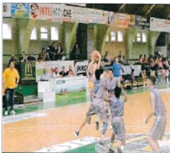
FAIR-PLAY. Le 49 e tournoi et le 12 e tournoi Loire Forez ont réuni vingt équipes de benjamins U13, dans un esprit de fair-play.

C'est finalement la formation voisine de la Chorale de Roanne qui a ins-