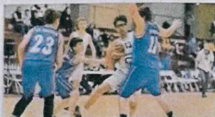
Les Roannais en blanc aux prises avec Cornella (Espagne) en bleu.